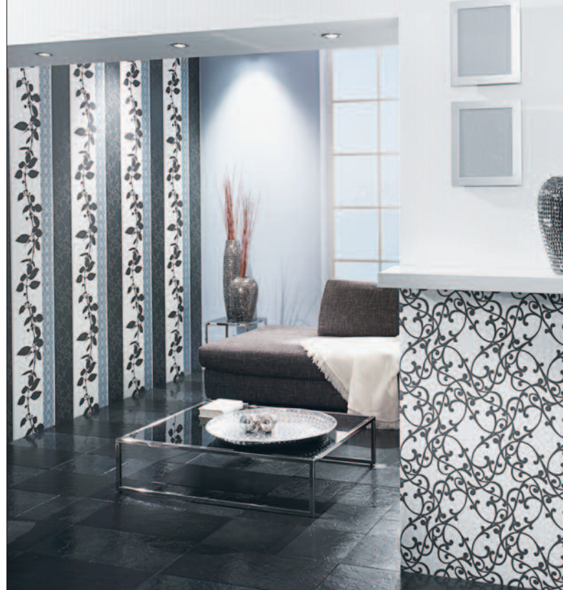
Die Kombination von floralen Themen mit Unis eignen sich für gemütliche Wohnwelten.