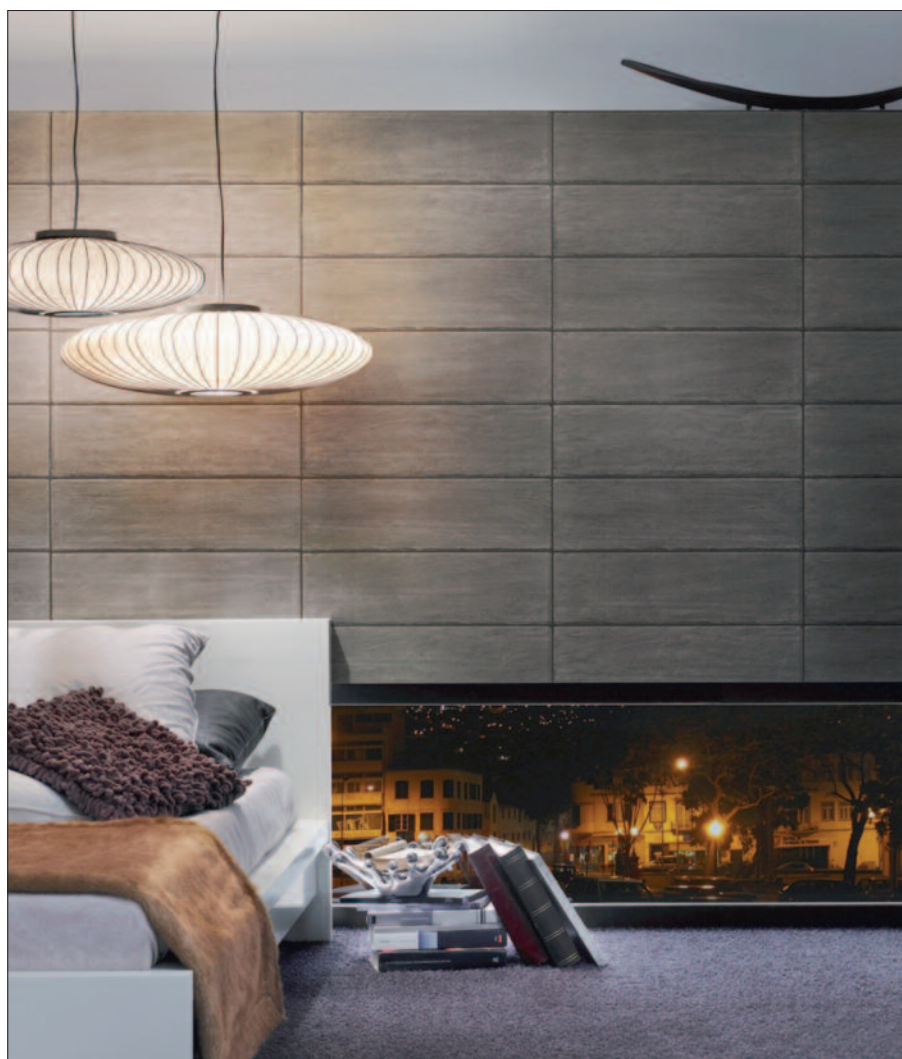
Die Tapeten in einer Schiefer-Optik erzeugen eine behagliche Atmosphäre.

puncto Struktur und Farbe individuell hierauf abgestimmt sein“, erläutert Hasenclever. Aspekte der Wohngesundheit werden dank der Vliesfaserqualität berücksichtigt – diese ist frei von PVC, Vinyl oder anderen geschäumten Kunststoffen. Passend zum digitalen Bildmotiv lässt sich deren Druck sowohl auf einem glatten Erfurt-Variovlies als auch auf drei verschieden geprägten Vliesfasertapeten realisieren. Diese können in Wandklebetechnik oder mit der Tapeziermaschine verarbeitet werden. Die Tapetenbahnen werden randlos in 75er Breite geliefert.