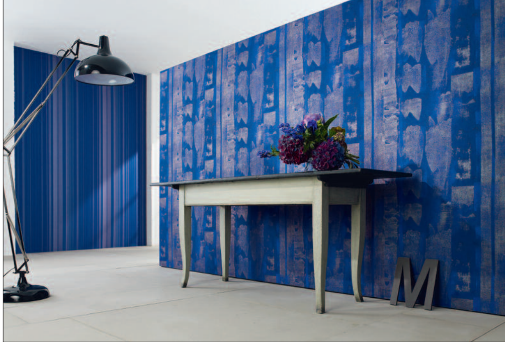
Ein starkes Blau wird mit changierendem Silber zur Augenweide.