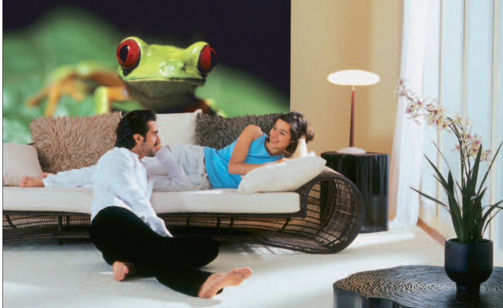
Lebensecht wirkt dieser Frosch durch den hochwertigen Digitaldruck.

Die Kollektion „Emocion“, die Rasch auf der Heimtextil vorstellt, findet