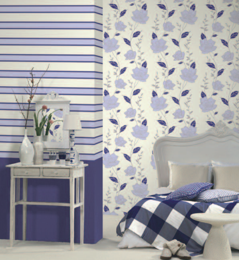
Die Kombination von floralen Mustern und Streifen – hier in Flieder – steht nach wie vor hoch im Kurs.